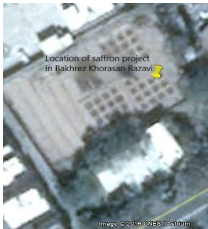
شکل ۱- موقعیت جغرافیایی و شمایی هوایی طرح