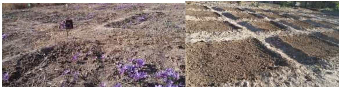
شکل ۲- مراحل کاشت و داشت و برداشت طرح Figure 2- Planting, growth, development and harvesting stages.

سطح و وزن کلاله خشک در واحد سطح) و صفات مربوط به بنه زعفران (تعداد بنه دختری در واحد سطح) اعمال شد. برای