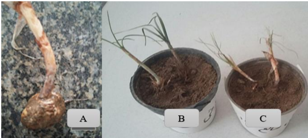
شکل ۱- (A) علائم ایجادشده توسط جدایه F. oxysporum بر روی بنه زعفران وحشی (B) زعفران وحشی شاهد (C) علائم ایجادشده توسط جدایه F. oxysporum بر روی زعفران وحشی منطقه صالح‌آباد استان ایلام

بر روی گل زنبق در ایتالیا مشاهده شد (Gullino et al., 1983) علاوه بر این، پرگنه از F. oxysporum f. sp. gladioli عامل ایجاد بیماری در زعفران در کشورهای دیگر ممکن است به