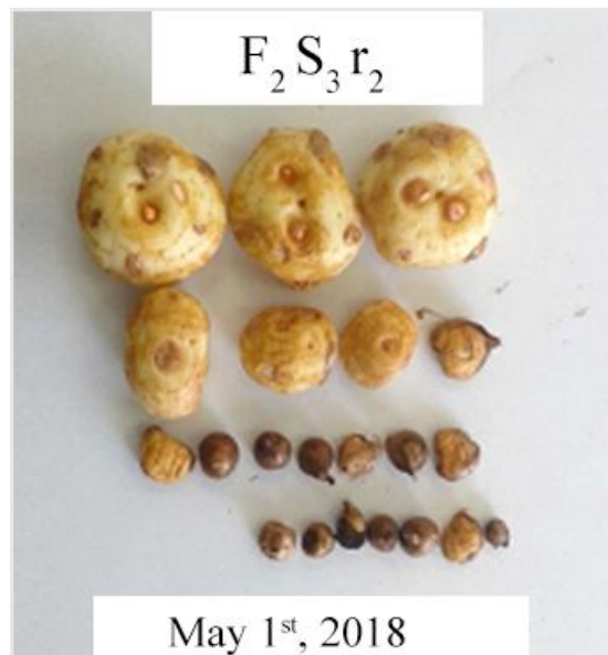
شکل ۳- بنه‌های دخترتری برداشت شده از مزرعه زعفران پس از اتمام دوره رشد گیاه در اردیبهشت ماه ۱۳۹۷ (بنه‌ها متعلق به تکرار ۲ تیمار کود دامی-بنه بزرگ می‌باشند).

به معنی دار نبودن همبستگی بین تعداد بنه دخترتری و صفات مرتبط با عملکرد گیاه در سال دوم، منجر به کاهش اختلاف بین سطوح فاکتور وزن بنه مادری در سال دوم انجام آزمایش شده است. به بیان دیگر اختلاف بین وزن بنه‌ها در سال اول که با کاشت بنه‌های مادری بزرگ، متوسط و کوچک به وجود آمده بود با توجه به رفتار رشدی گیاه و تمایل به افزایش تعداد بنه‌های دخترتری بجای افزایش وزن بنه در دومین سال انجام آزمایش کاهش یافته است که طبیعتاً منجر به کاهش اختلاف بین تیمارهای آزمایشی نیز می‌شود.