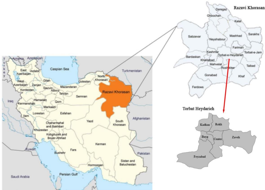
شکل ۲- منطقه مورد مطالعه Figure 2- Location of study area.

اصلی جهت تبیین ساختارهای پنهان در چالش‌های صنعت زعفران استفاده شد.