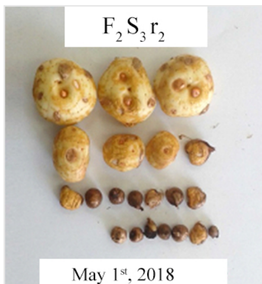
شکل ۳- بنه های دختره برداشت شده از مزرعه زعفران پس از اتمام دوره رشد گیاه در اردیبهشت ماه ۱۳۹۷ (بنه ها متعلق به تکرار ۲ تیمار کود دامی-بنه بزرگ می باشند).

به معنی‌دار نبودن همبستگی بین تعداد بنه دختره و صفات مرتبط با عملکرد گیاه در سال دوم، منجر به کاهش اختلاف بین سطوح فاکتور وزن بنه مادری در سال دوم انجام آزمایش شده است. به بیان دیگر اختلاف بین وزن بنه‌ها در سال اول که با کاشت بنه‌های مادری بزرگ، متوسط و کوچک به وجود آمده بود با توجه به رفتار رشدی گیاه و تمایل به افزایش تعداد بنه‌های دختره بجای افزایش وزن بنه در دومین سال انجام آزمایش کاهش یافته است که طبیعتاً منجر به کاهش اختلاف بین تیمارهای آزمایشی نیز می‌شود.